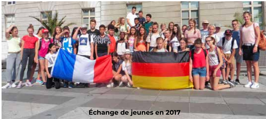
Échange de jeunes en 2017

Le jumelage avec l'Allemagne et l'Italie est une expérience enrichissante. Cet échange permet de voir différentes cultures, de voir différents paysages ainsi que les mœurs de chaque pays. C'est également pratique sur le plan de la pédagogie, apprendre une langue en s'exerçant avec des personnes parlant ladite langue est toujours mieux.