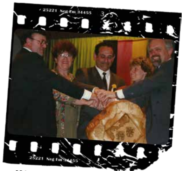
1991 : 20 ème anniversaire à Freigericht