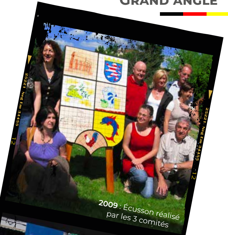
2009 : Écusson réalisé par les 3 comités