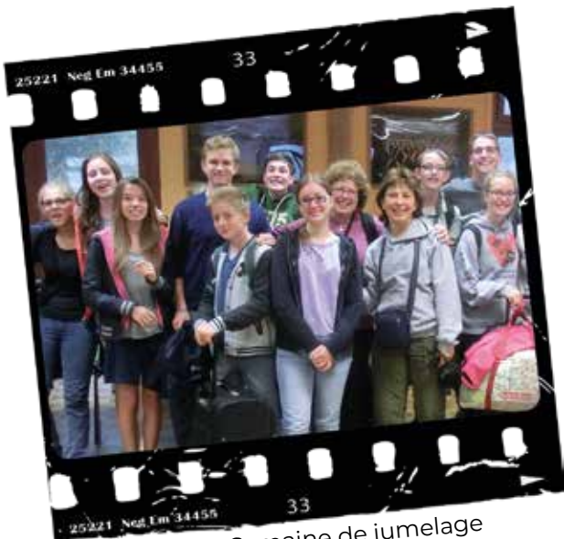
2000 : Semaine de jumelage Départ des jeunes