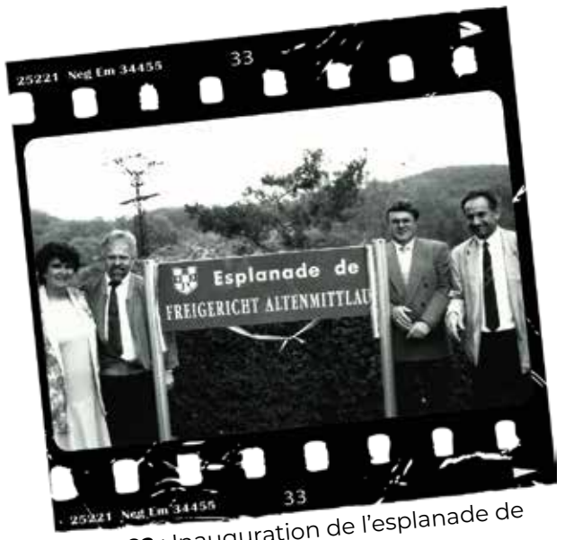
1992 : Inauguration de l'esplanade de Freigericht