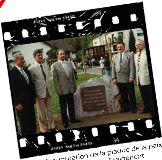
1996 : Inauguration de la plaque de la paix entre les peuples à Freigericht