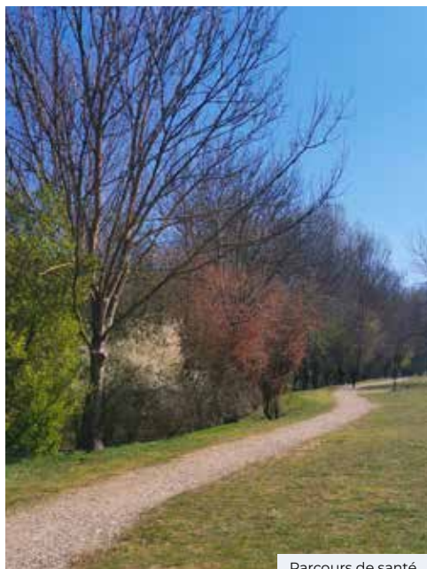
Parcours de santé

Une allée du Parcours de santé sera dénommée Freigericht. Elle se terminera par un bosquet fleuri accompagné d'un panneau directionnel indiquant le nombre de kilomètres reliant St-Quentin-Fallavier à Freigericht. La contre-allée sera baptisée Galicano nel Lazio en 2022, à l'occasion des 20 ans de jumelage avec notre commune jumelle italienne.