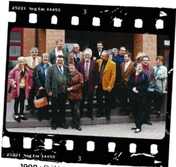
1998 : Délégations allemandes et françaises à Freigericht