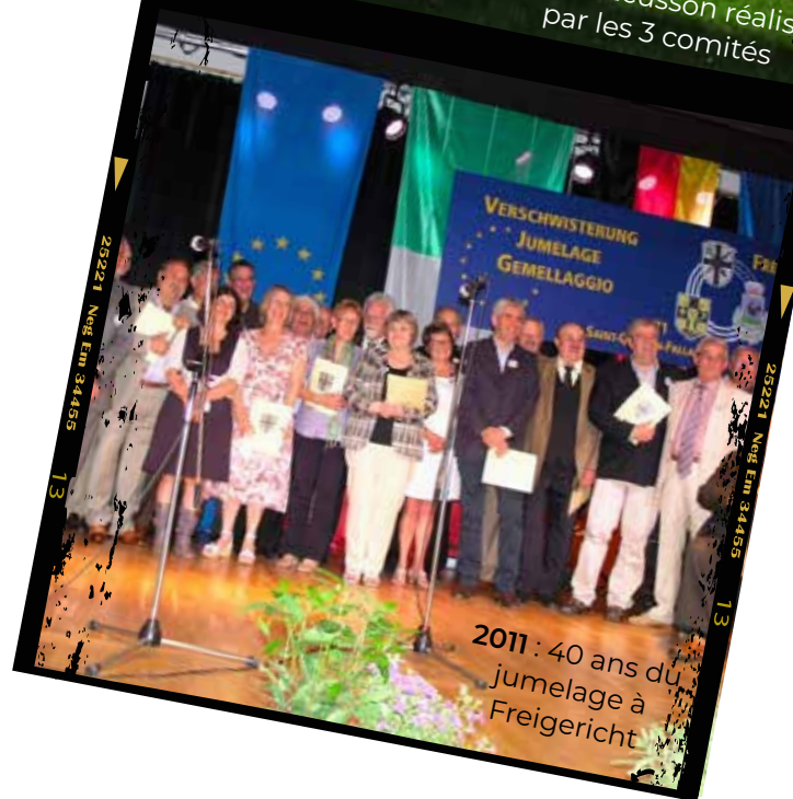
2011 : 40 ans du jumelage à Freigericht