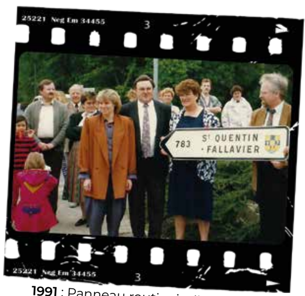
1991 : Panneau routier indiquant la distance entre nos 2 communes