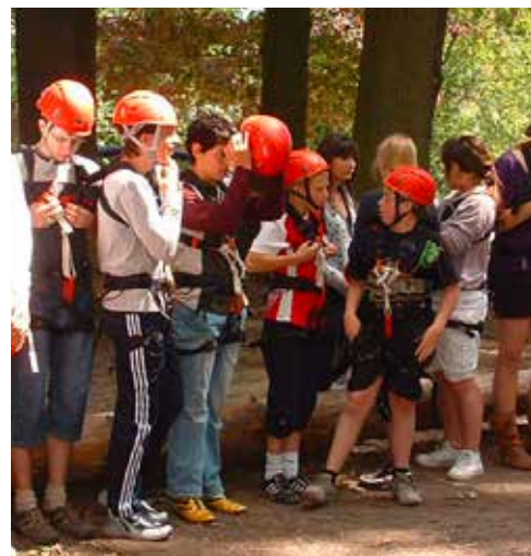
Sortie accrobranche en Allemagne