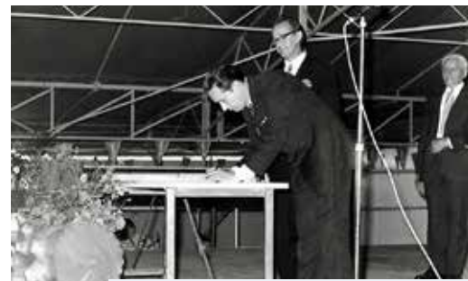
1972 : Signature du serment de jumelage