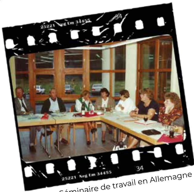
1990 : Séminaire de travail en Allemagne