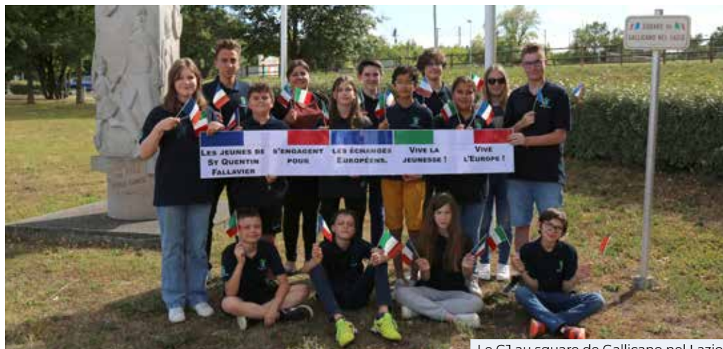
Le CJ au square de Gallicano nel Lazio

Toujours très impliqué dans la vie de la Commune, le Conseil Jeunes a souhaité transmettre un message à nos amis italiens pour célébrer ces 20 ans d'amitié.