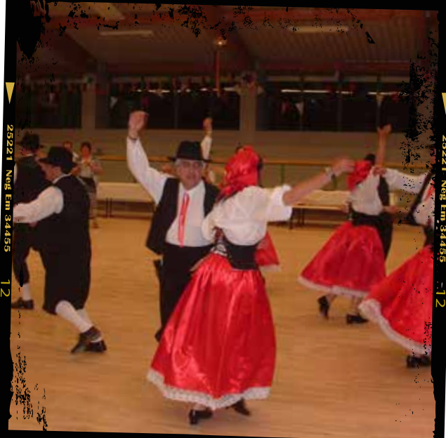
2006 : Rencontres citoyennes