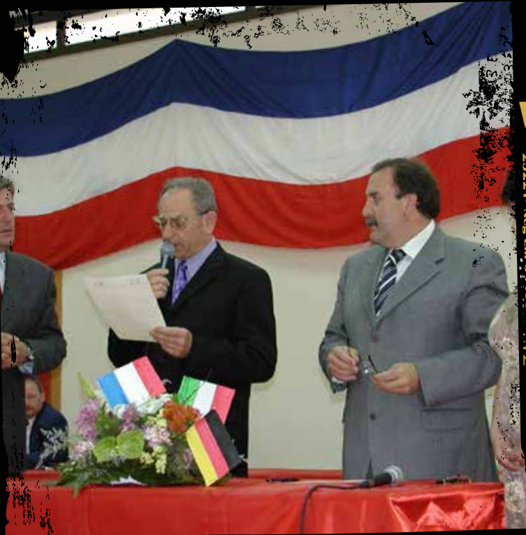
2002 : Signature officielle à Gallicano nel Lazio