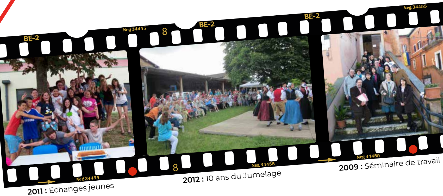
2011 : Echanges jeunes