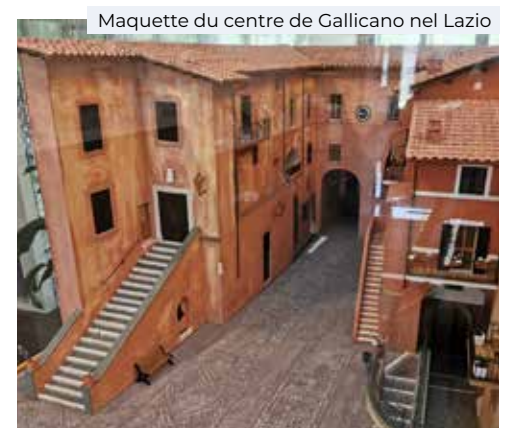
Maquette du centre de Gallicano nel Lazio