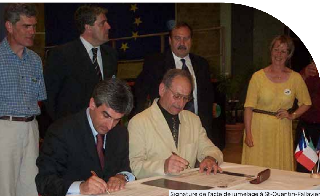
Signature de l'acte de jumelage à St-Quentin-Fallavier

Le centre historique de la ville date de l'an 1000 et de grandes familles, telles que les Colonna, ont marqué son histoire. Ce centre a été représenté sous forme de maquette offerte à la Municipalité St-Quentinoise.