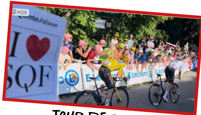
TOUR DE FRANCE