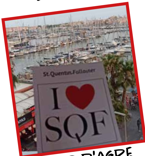
LE CAP D'AGDE