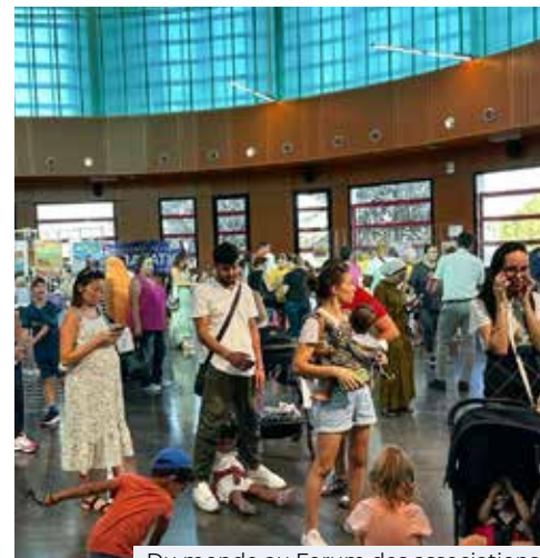
Du monde au Forum des associations

La semaine qui suit le forum a été l'occasion pour un grand nombre de tester une nouvelle activité et peut être pour certains de se découvrir une passion ou de s'engager en devenant bénévole.