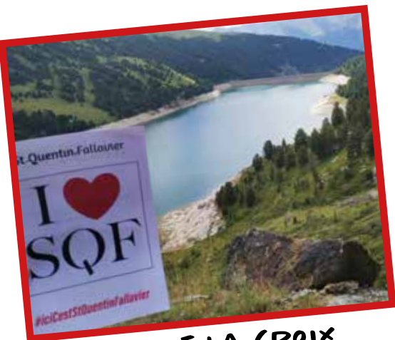
LAC DE LA CROIX