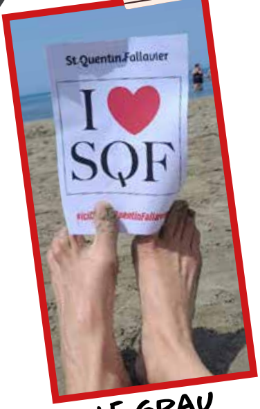
LE GRAU DU ROI