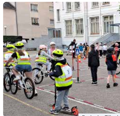
Ecole des Tilleuls

Chaque printemps, les agents de la Police Municipale en partenariat avec un IDSR (Intervenant Départemental de la Sécurité Routière) proposent à l'ensemble des élèves de CM2 de la Commune une formation théorique puis une mise en pratique, à vélo ou en trottinette, pour apprendre et appliquer les bons gestes sur la piste routière. En 2023, 81 élèves ont reçu leur certificat de réussite à l'APER