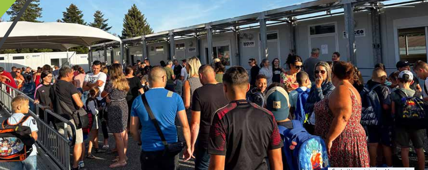
École élémentaire Les Marronniers