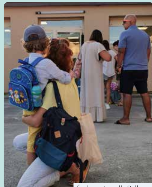
École maternelle Bellevue

Accueillir les écoliers dans les meilleures conditions possibles au sein des établissements scolaires de la commune, tel est l'objectif renouvelé des élus et des services municipaux en cette rentrée 2023.