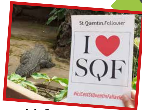
LA FERME AUX CROCODILES