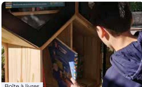
Boîte à livres

➤ Les lundi, mardi et jeudi de 16h30 à 18h en période scolaire au Centre de l'Enfance, à la Maison des Habitants ou à l'école des Moines.