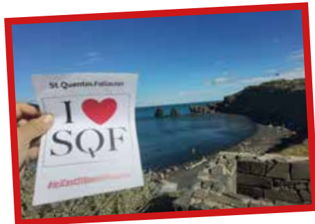
LE CAP D'AGDE