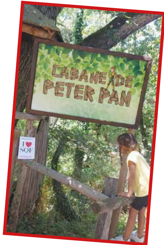
MIRIPILI L'ÎLE AUX PIRATES