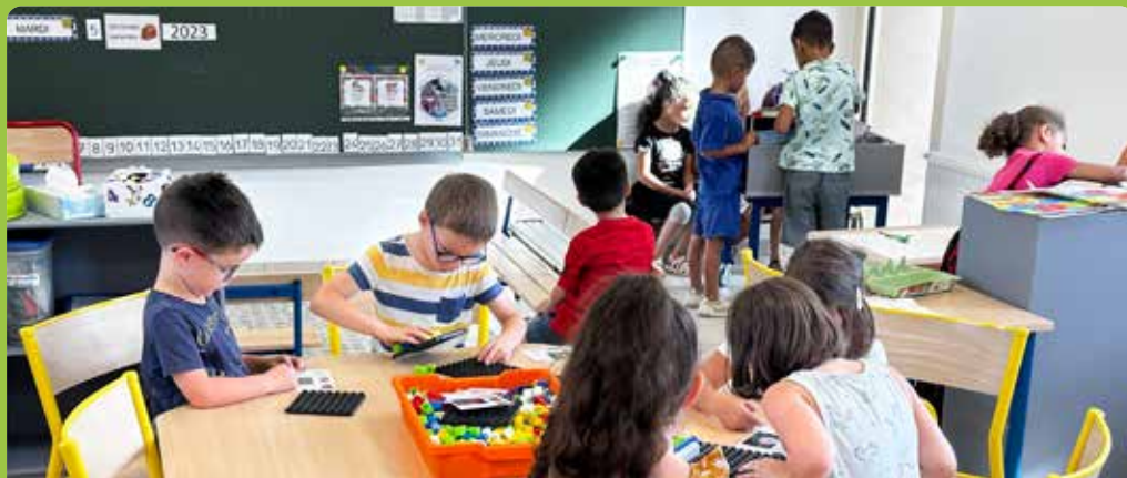
Renouvellement du mobilier de l'école Bellevue : chaises, tables, porte manteaux, bibliothèques, meubles de rangement, accessoires de classes, etc.

L'école Bellevue a réouvert ses portes lundi 4 septembre après une année de travaux qui a permis d'améliorer la performance énergétique de ce bâtiment de 658 m 2 , afin notamment de baisser les coûts de chauffage, d'électricité ou de consommation d'eau dans l'école. Des améliorations fonctionnelles ont également été réalisées en positionnant les classes et la partie restaurant scolaire différemment.