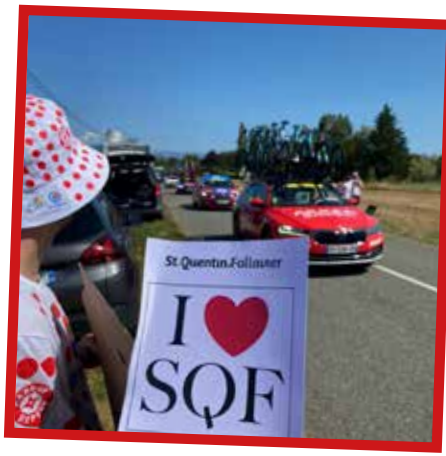
TOUR DE FRANCE