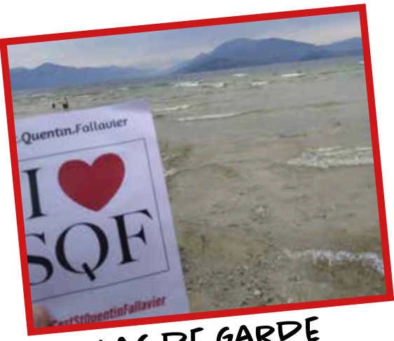
LAC DE GARDE