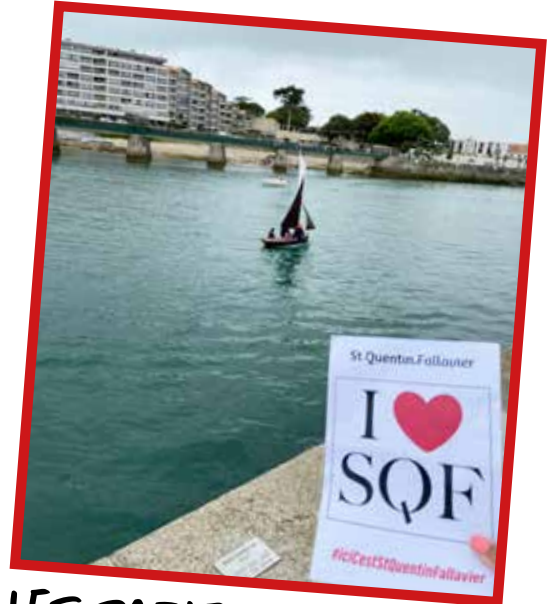
LES SABLES D'OLONNES