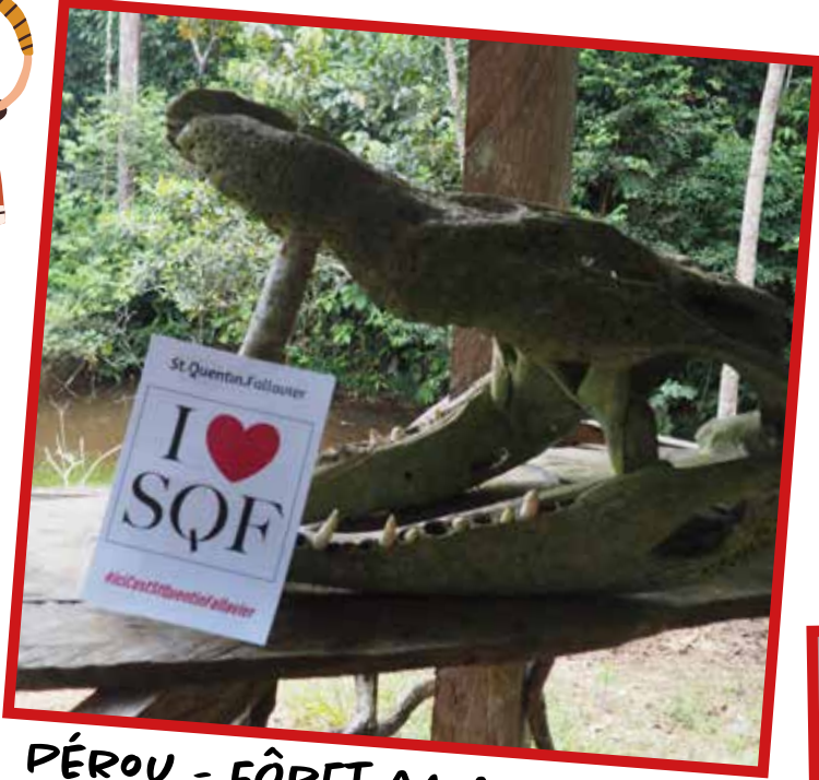
PÉROU - FÔRET AMAZONIENNE