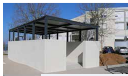
Logette poubelles place du Cygne

>>> Programme complet sur www-st-quentin-fallavier.fr