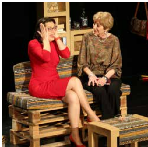
Spectacle «En avant toutes» à l'Espace G. Sand

Au programme : témoignages de femmes entrepreneuses, soirée à l'Espace George Sand avec le spectacle "En avant toutes", initiation à la danse modern jazz, karaoké, activités manuelles, etc.