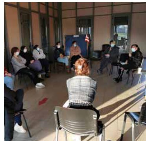
Témoignages de femmes entrepreneuses au Nymphéa