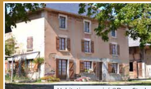
Habitation en pisé

Inventorier le bâti en pisé est une nécessité pour que la commune puisse faire état du potentiel de valorisation qu'il représente et de son état de conservation. Cet inventaire fera l'objet d'une restitution où seront présentées les valeurs architecturales du pisé et les caractéristiques de ce matériau ainsi que les préconisations en matière d'entretien et de restauration.