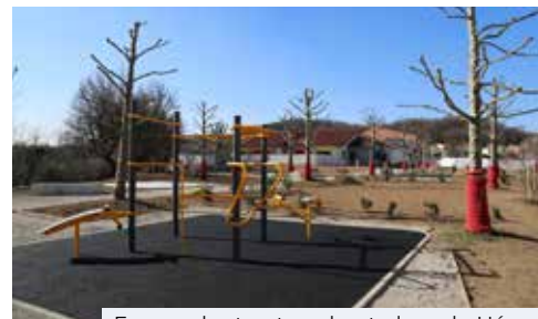
Espace de street workout place du Héron

> 16h30 : Temps protocolaire en présence du Maire, des élus et des partenaires institutionnels.