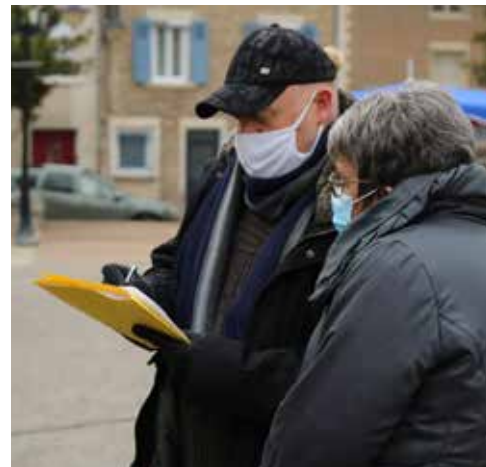
Les agents municipaux au contact des habitants

En janvier, près de 200 St-Quentinois ont été interrogés. L'étude se poursuit au printemps avec des entretiens auprès des principaux acteurs du territoire afin de faire ressortir les problématiques sociales de la Commune et de proposer un ensemble de préconisations et propositions d'axes d'intervention.