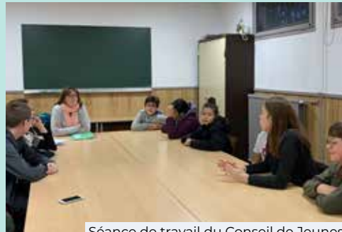
Séance de travail du Conseil de Jeunes

En raison de la COVID-19, le projet est en pause pour cette année. Si la situation sanitaire se stabilise, les jeunes pourront se rendre sur place au printemps 2021 pour distribuer leurs cadeaux.