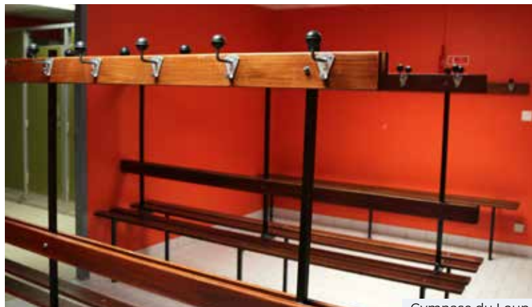
Gymnase du Loup

Réfection des vestiaires et des douches : 9 000 € TTC (douches, plomberie, faux plafonds, grilles VMC, pavés LED)