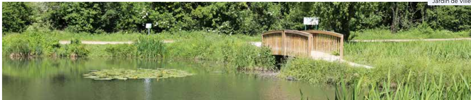
Jardin de Ville

L es sites patrimoniaux remarquables (SPR) sont « les villes, villages ou quartiers dont la conservation, la restauration, la réhabilitation ou la mise en valeur présente, au point de vue historique, architectural, archéologique, artistique ou paysager, un intérêt public ». Un tel dispositif issu d'un partenariat commune/Etat a pour objectif de protéger et de mettre en valeur l'espace urbain et/ou rural. Mais qui dit protection dit règles ! et avant tout, il faut définir un périmètre qui doit être retranscrit dans un plan.