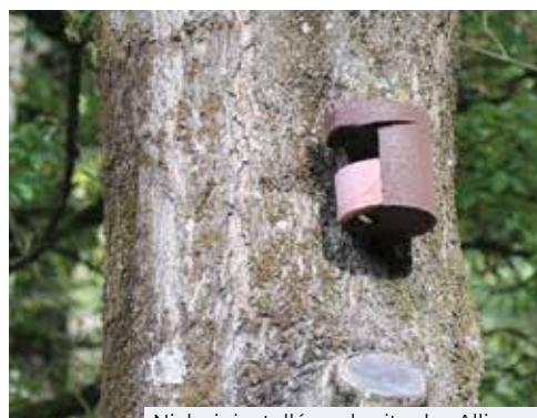
Nichoir installé sur le site des Allinges

▶ Protection des oiseaux et des micromammifères : 14 nichoirs pour les oiseaux et les petits rongeurs ont été installés sur le Parc de Fallavier et le site des Allinges avec l'aide de l'APIE (Association Porte de l'Isère Environnement).