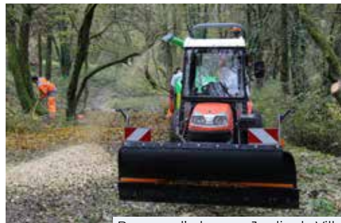
Broyage d'arbres au Jardin de Ville

redirigent vers les structures compétentes : la CAPI pour les voiries communautaires ou les bâtiments dont elle assure la gestion (piscine), le Département pour les voiries départementales, le SMND pour le ramassage des ordures ménagères, etc.