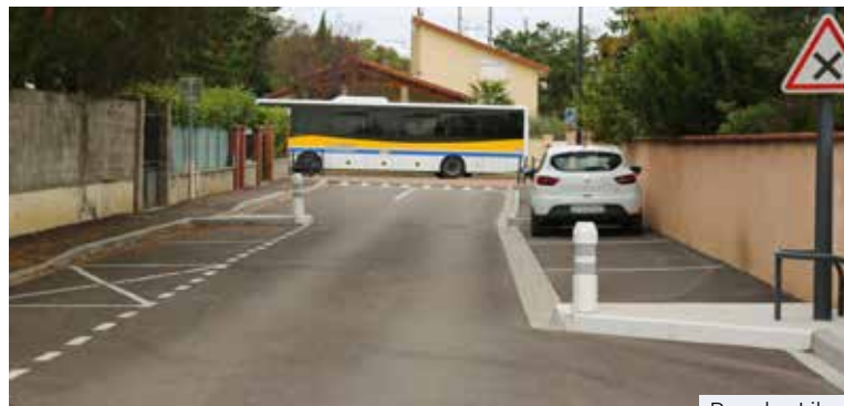
Rue des Lilas