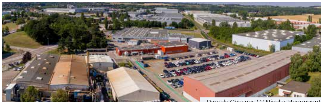
Parc de Chesnes

Saint-Quentin-Fallavier est aussi une commune marquée par un fort accroissement des zones d'activités, en particulier avec l'ensemble du