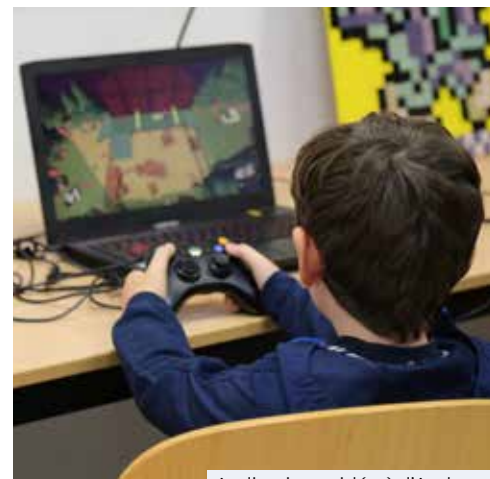
Atelier jeux vidéo à l'Arobase

L'objectif n'est pas de pointer du doigt les jeux vidéo, mais plutôt d'en démontrer leurs bienfaits quand ils sont utilisés à bon escient.