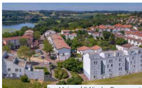
Les Moines

L a commune de Saint-Quentin-Fallavier est intégrée à l'agglomération de la CAPI (Communauté d'Agglomération Porte de l'Isère). A ce titre, elle est amenée à se développer pour participer à la production de logements en réponse aux besoins importants du territoire.