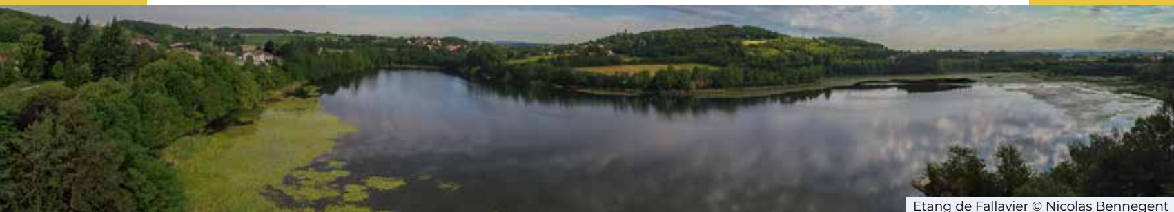
Etang de Fallavier

Aujourd'hui l'étang de Fallavier, propriété de la Commune, est classé Espace Naturel Sensible (ENS). Sa grande roselière et ses herbiers aquatiques servent de lieu de vie et de reproduction à de nombreuses espèces ainsi que d'étape pour certains oiseaux migrateurs. On peut y apercevoir des espèces protégées comme le blongios nain ou la tortue cistude mais aussi des variétés plus fréquentes comme le canard colvert, le foulque, le crapaud ou encore la carpe.