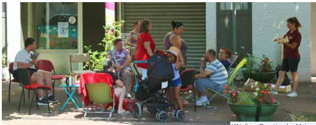
L'Atelier - Quartier des Moines

A travers un réseau d'actions collectives gratuites, la Commune de St-Quentin-Fallavier fait perdurer les valeurs de l'action sociale. La pluralité des offres proposées permet aux personnes de trouver des activités diversifiées et adaptées à leur besoin :