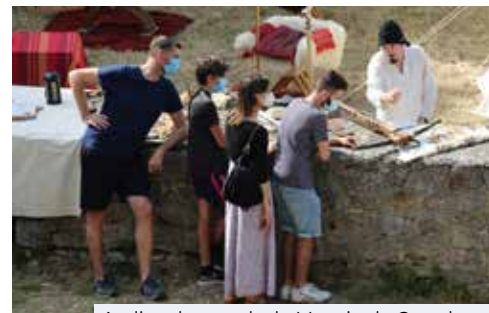
Atelier chasse de la Mesnie de Castelnaud

Le château de Fallavier a accueilli des ateliers et des démonstrations tournés vers la vie civile des XIII e et XV e siècle. Le public a pu ainsi découvrir le travail du cuir, celui de la laine mais également l'importance de la chasse ou de la place de la femme dans la société médiévale. Le Cercle d'Armes du Dauphiné a initié les visiteurs à la cartographie médiévale tandis que la Mesnie de Castelnaud faisait découvrir aux curieux l'échange des savoirs grâce aux marchands durant le XV e siècle.