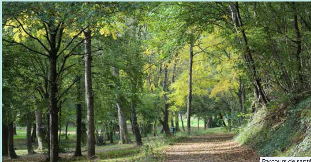
Parcours de santé

L es abattages réalisés pour des raisons de sécurité ne concernent que des arbres morts sur pied ou dépérissants, ou présentant des blessures ou pathogènes (champignons lignivores notamment) qui engagent un risque de chute ou de casse. Quand on abat un arbre, c'est que l'on a épuisé toutes les solutions possibles.