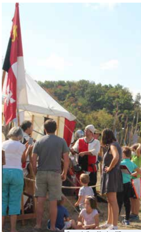
Stand d'artillerie d'Escossor

► L'atelier sur l'artillerie proposé par Escossor et en particulier les simulations de tirs avec différents calibres de bouches à feu ont permis au public de vivre une véritable immersion visuelle et auditive.