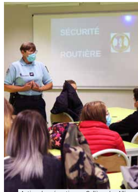
Action de prévention au Collège des Allinges