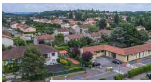
Le Loup

Mais la commune de Saint-Quentin-Fallavier est impactée très directement par les contraintes de l'aéroport de Saint-Exupéry. Sur le territoire communal, les prescriptions du PEB (Plan d'Exposition aux Bruits) entrent en contradiction directe avec les objectifs de production de logements de la CAPI et du SCOT (Schéma de COhérence Territoriale) pour l'agglomération.