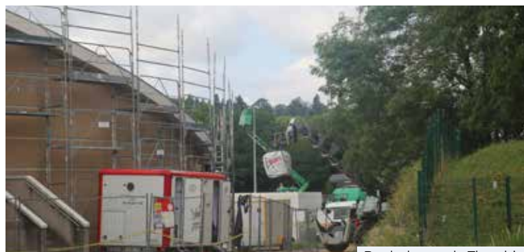
Boulodrome de Tharabie