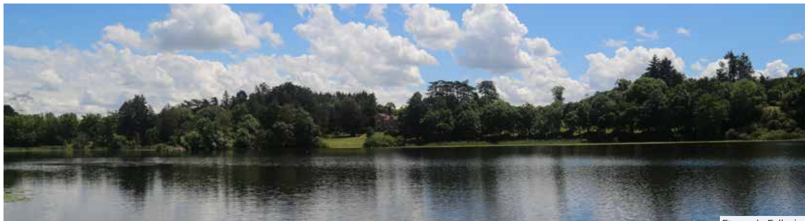
Etang de Fallavier