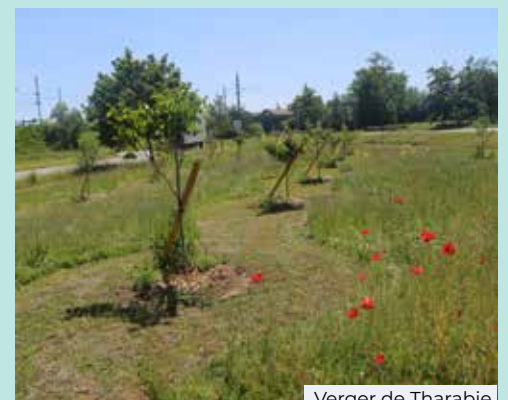
Verger de Tharabie