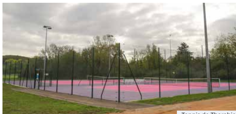
Tennis de Tharabie