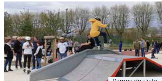
Rampe de skate