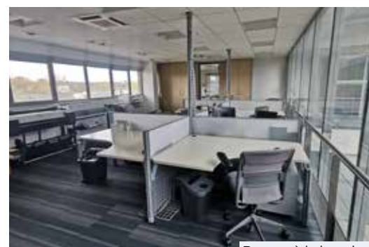
Bureau à la location