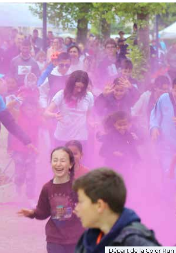
Départ de la Color Run

Le succès était au rendez-vous de cette première édition qui a rassemblé 400 personnes autour du plaisir de faire du sport en extérieur.