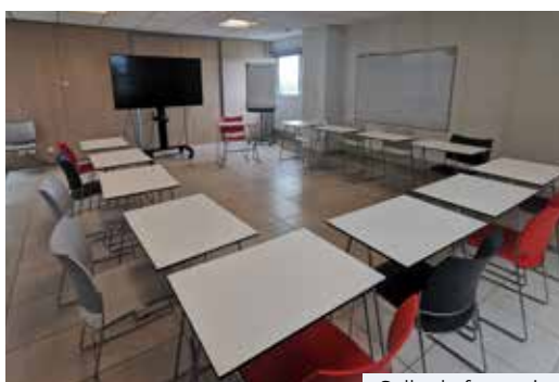
Salle de formation