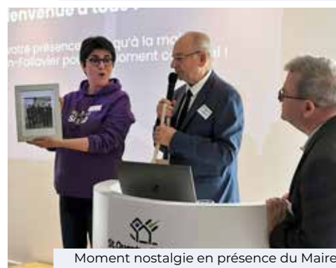
Moment nostalgie en présence du Maire et des co-fondateurs.