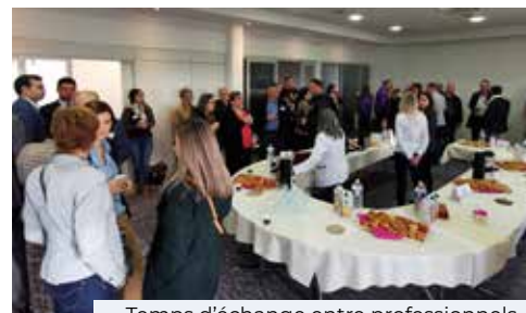
Temps d'échange entre professionnels