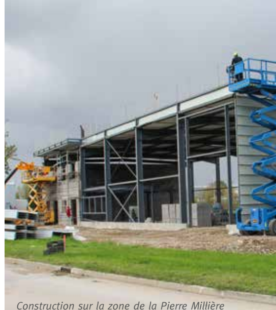
Construction sur la zone de la Pierre Millière