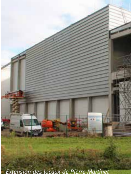
Extension des locaux de Pierre Martinet