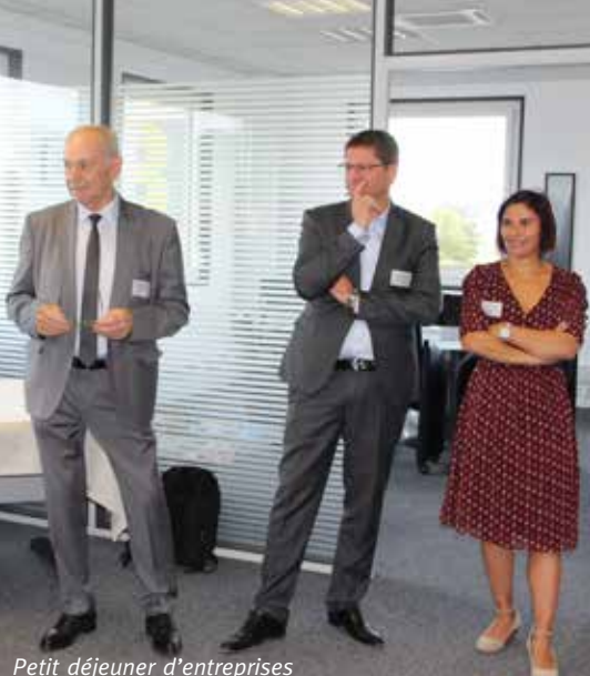
Petit déjeuner d'entreprises