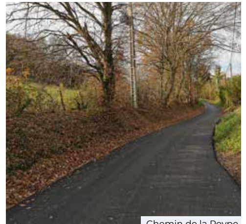
Chemin de la Poype

Le stationnement gênant sur les trottoirs est interdit.