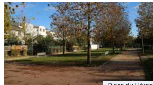
Place du Héron