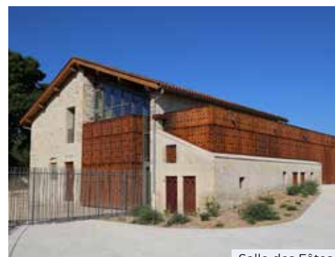
Salle des Fêtes