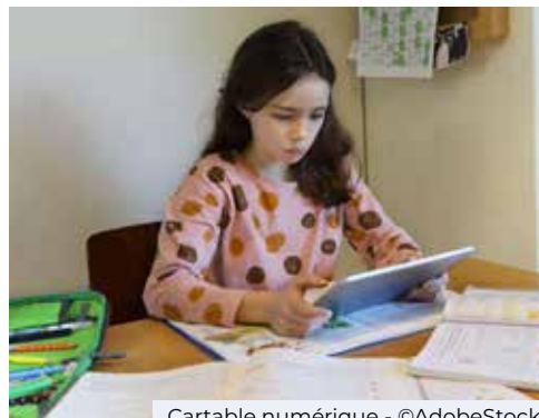
Cartable numérique