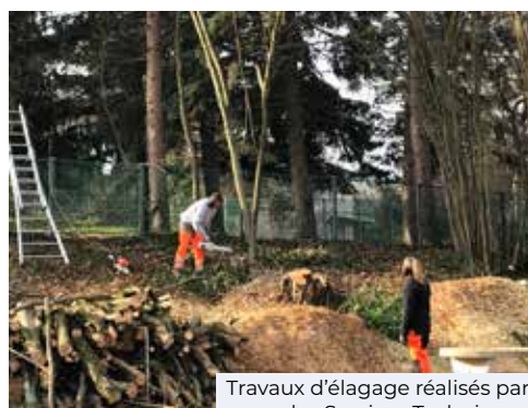
Travaux d'élagage réalisés par les Services Techniques