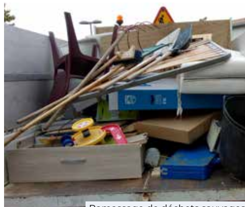
Ramassage de déchets sauvages

déchets sont à votre disposition afin de maintenir la propreté de la commune et garantir l'hygiène et la sécurité de tous.