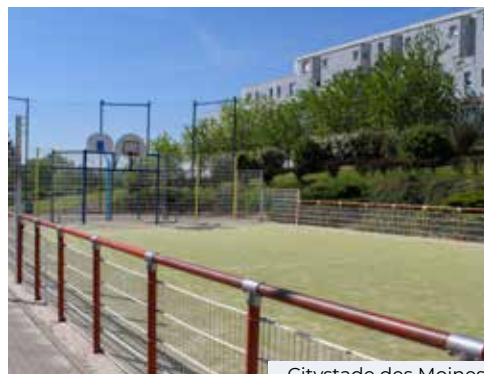
Citystade des Moines