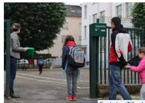
Ecole Les Tilleuls

avant les fêtes, les élus st-quentinois ont décidé de ne pas facturer les familles absentes sur les temps périscolaires.