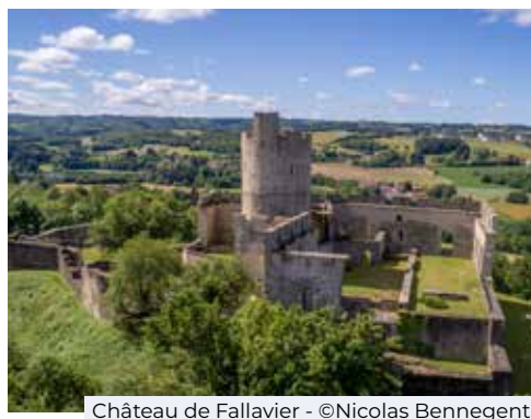
Château de Fallavier - ©Nicolas Bennegent