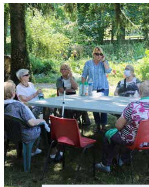
Repas partagé aux Jardins du Merlet