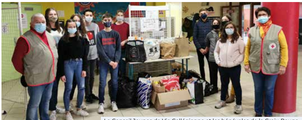
Le Conseil Jeunes de Vie Collégienne et les bénévoles de la Croix-Rouge

Pendant 4 jours, 15 collégiens ont fait campagne avec des affiches et des flyers auprès de leurs camarades pour les sensibiliser et récolter un maximum de denrées. Une méthode qui a fonctionné, car les stocks étaient plus importants que l'an passé. La Ville félicite les élèves pour ce geste engagé et solidaire.