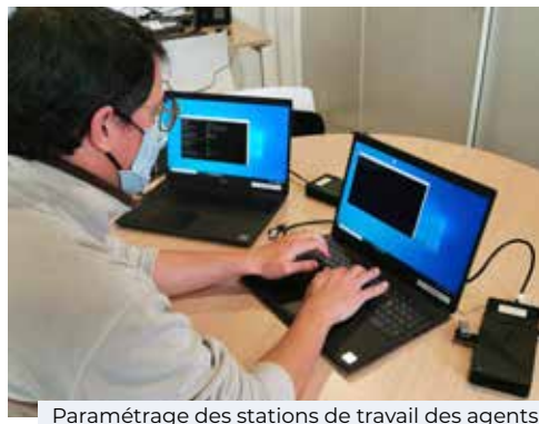
Paramétrage des stations de travail des agents