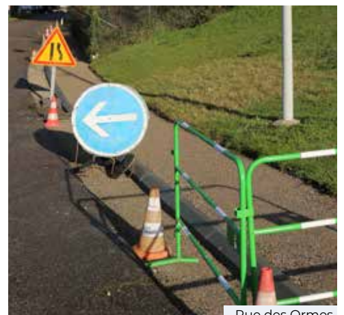
Rue des Ormes