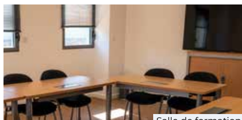
Salle de formation

L'évolution de la réglementation de la sécurité au travail, sa mise en œuvre et ses impacts sur le sys-