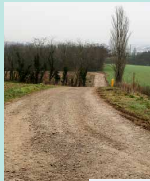
Chemin des Briches

Ensemble, protégeons notre cadre de vie et respectons la nature !