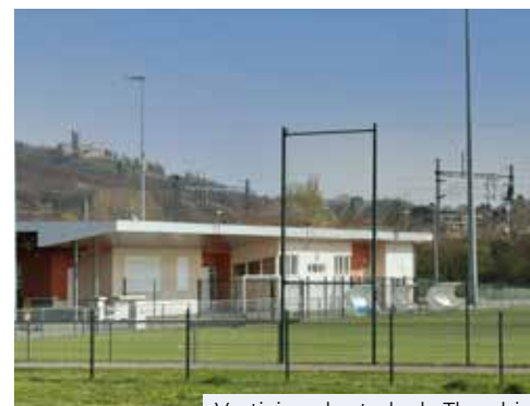
Vestiaires du stade de Tharabie

Il répond par ailleurs de manière ambitieuse aux difficultés créées par la crise sanitaire, grâce à une redistribution de crédits sur les secteurs et des actions venant en soutien direct aux Saint-Quentinois.es, aux associations et aux entreprises en difficulté, faisant enfin la part belle aux animations et à la culture afin de retrouver de la joie de vivre en 2021.