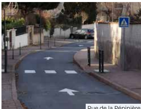
Rue de la Pépinière

► La structure de la rue de la Pépinière s'est dégradée prématurément laissant apparaître diverses fissures dans l'enrobé causées par le trafic routier important sur cette voirie. La structure a été reprise et une couche d'enrobé a été appliquée pour pérenniser cette voie. Cette rue étant communautaire, les travaux ont été gérés et financés par la CAPI à hauteur de 74 000 €.