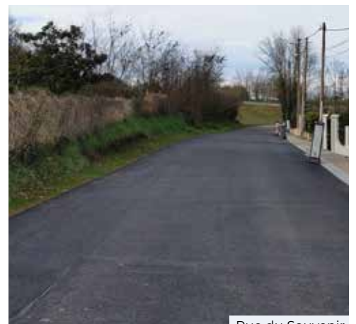
Rue du Souvenir

► Pour les chemins ruraux , des travaux permettront de rendre plus accessibles et moins dangereuses certaines zones pour les agriculteurs, les promeneurs et les cyclistes.