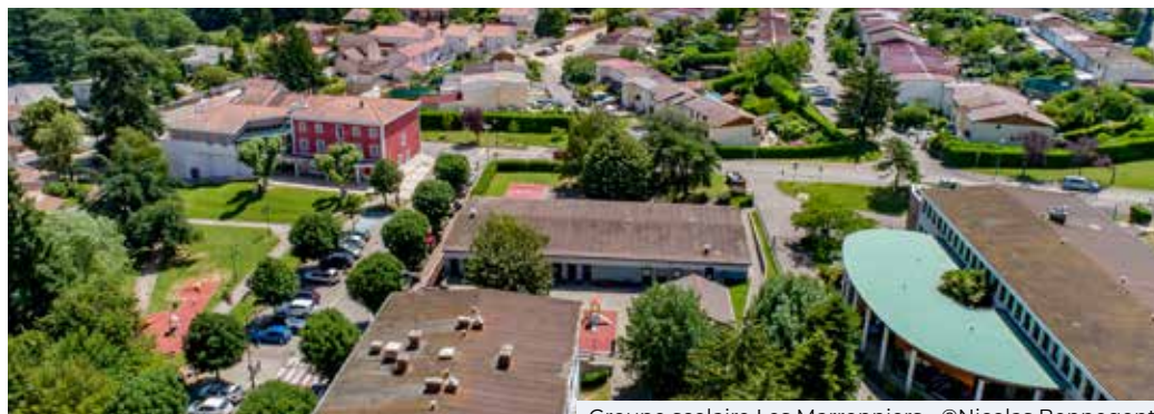
Groupe scolaire Les Marronniers