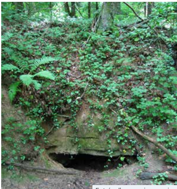
Entrée d'une ancienne mine

Les affleurements du gisement de fer ont été initialement exploités en petites carrières à ciel ouvert vers 1840 avant de faire l'objet de concessions autorisant l'exploitation par travaux souterrains à partir de 1843.