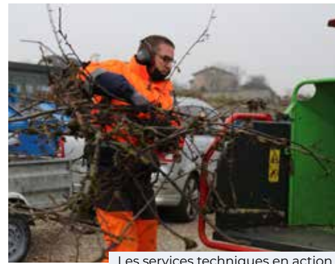
Les services techniques en action

Avec cette action de sensibilisation, la Commune propose une alternative zéro déchet permettant de réduire le volume de végétaux déposés en déchetterie.