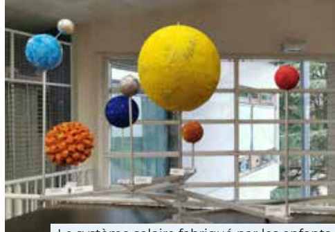
Le système solaire fabriqué par les enfants

Ainsi, de septembre à octobre, enfants et animateurs ont retenu le thème « ça gravite » pour ainsi percevoir le système solaire ! De cette découverte est née une maquette grandeur nature fabriquée et construite avec la collaboration du service technique de la commune. Les enfants de 6-11 ans ont participé à une sortie pédagogique au Planétarium de Lyon mais se sont aussi glissés dans la