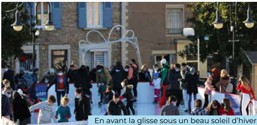
En avant la glisse sous un beau soleil d'hiver