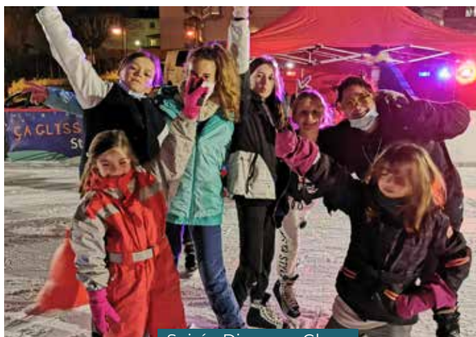
Soirée Disco sur Glace