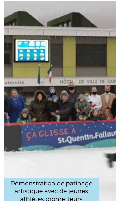
Démonstration de patinage artistique avec de jeunes athlètes prometteurs