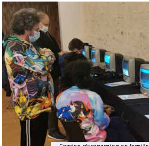
Session rétrogaming en famille

V endredi 3 décembre, la soirée gaming « Geek en Famille » a clôturé le projet prévention autour des jeux en réseau et de la place du jeu dans les familles. Une quarantaine de participants est venue célébrer le jeu sous toutes ses formes.