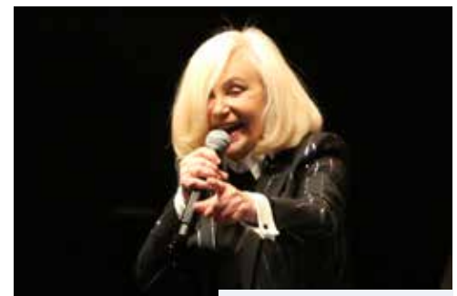
La chanteuse fait le show

À l'issue du spectacle, l'artiste est restée sans compter à la disposition