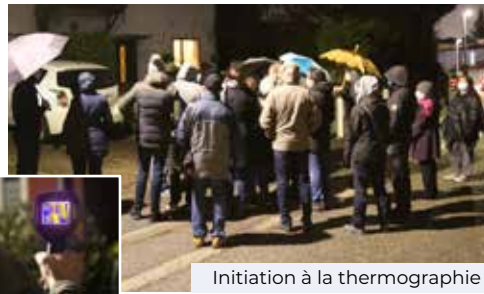
Initiation à la thermographie

A vec l'arrivée de l'hiver et d'une période de chauffage plus soutenue, qui ne s'est jamais posé la question de la déperdition énergétique de son habitation ? La Ville, en partenariat avec l'Association pour une GEstion Durable de l'ENergie (AGEDEN) a proposé une soirée thermographique le 7 décembre dernier pour prendre conscience des conditions de l'efficacité énergétique et donner toutes les clefs pour réduire sa consommation de chauffage et au final sa facture.