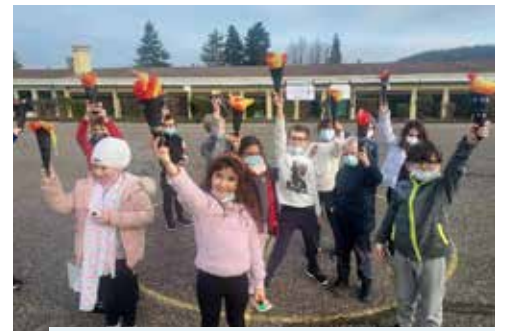
Flamme olympique pour les athlètes en herbe

Tout d'abord, le lundi 13 décembre, était organisé un courseton ELA «bats la maladie» qui a rassemblé les 147 élèves de l'école, en partenariat avec la MAIF, la MAE et la Croix-Rouge. Ils ont parcouru autour de l'école 307km et rapporté 31 euros (0,1 euros du km). Au cours de cette activité, des médailles, des affiches et des bouquets de fleurs à l'effigie des JO ont été réalisés par des élèves.