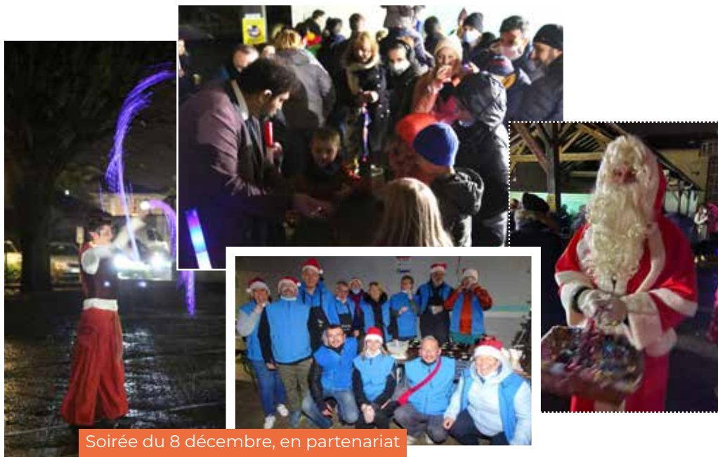
Soirée du 8 décembre, en partenariat avec le Comité des Fêtes