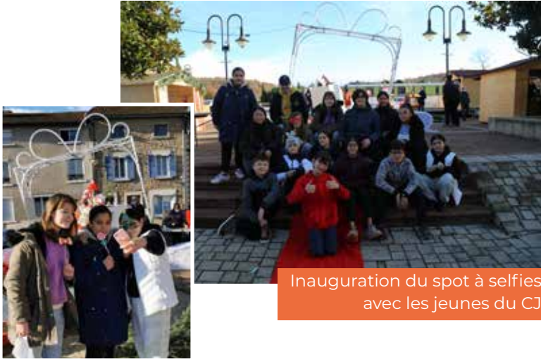
Inauguration du spot à selfies avec les jeunes du CJ