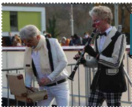
Les clowns ont fait le show pour l'ouverture de la patinoire