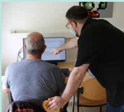
Accompagnement individuel proposé à l'Arobase

> Accueil des usagers autonomes qui souhaitent effectuer leurs démarches en ligne (accès à un ordinateur et à internet) durant les temps d'ouverture en accès libre.