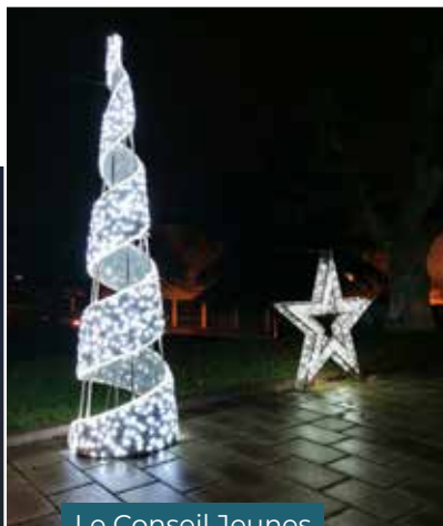
Le Conseil Jeunes et les illuminations du Centre-Ville