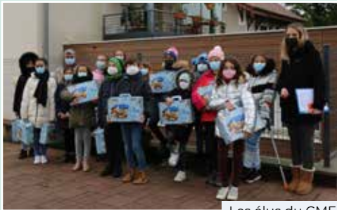
Les élus du CME

09 50 79 15 36 // 24 impasse de la Chartreuse