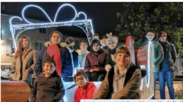
Les jeunes posent devant la saynète de Noël

L es membres du Conseil Jeunes s'étaient donnés rendez-vous mercredi 15 décembre aux abords de la patinoire pour célébrer la fin d'année et les fêtes à venir autour d'un goûter à emporter.