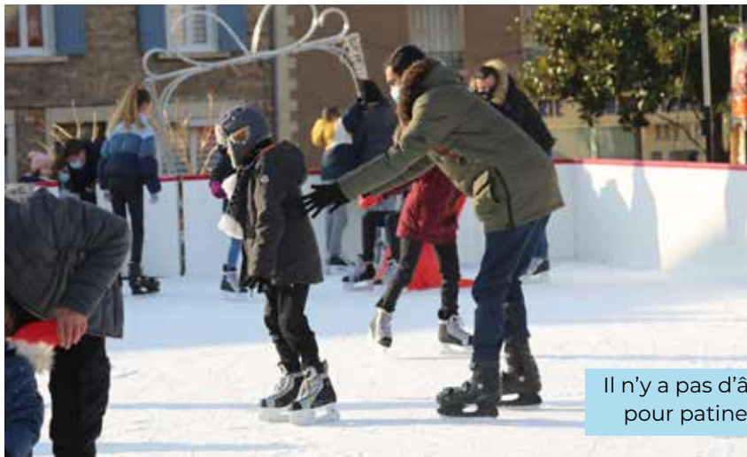
Il n'y a pas d'âge pour patiner