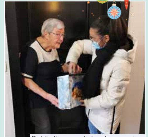
Distribution en porte à porte aux seniors

Comme à l'accoutumée, le Conseil Municipal Enfants a participé à la distribution des colis dans les immeubles des Géraniums et de la Pépinière, le mercredi 8 décembre. Un beau moment d'émotions entre deux générations, où les petits élus sont allés à la rencontre de leurs aînés pour leur souhaiter de joyeuses fêtes de fin d'année.