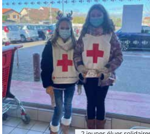
2 jeunes élues solidaires

A la fin de la journée, les enfants ont récolté 720kg grâce à leur motivation.