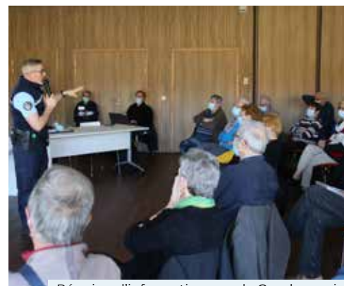
Réunion d'information avec la Gendarmerie

Une cinquantaine de personnes a participé à ce temps d'échanges où réflexes, astuces et points de vigilance ont été distillés pour assurer leur sécurité