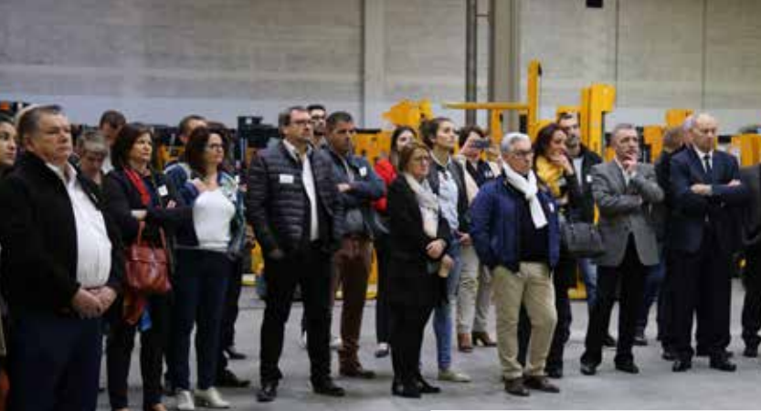
Petit-déjeuner chez JUNGHEINRICH