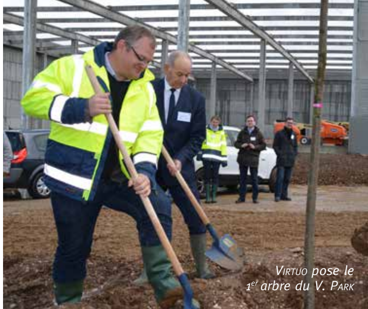
VIRTUO pose le 1 er arbre du V. PARK